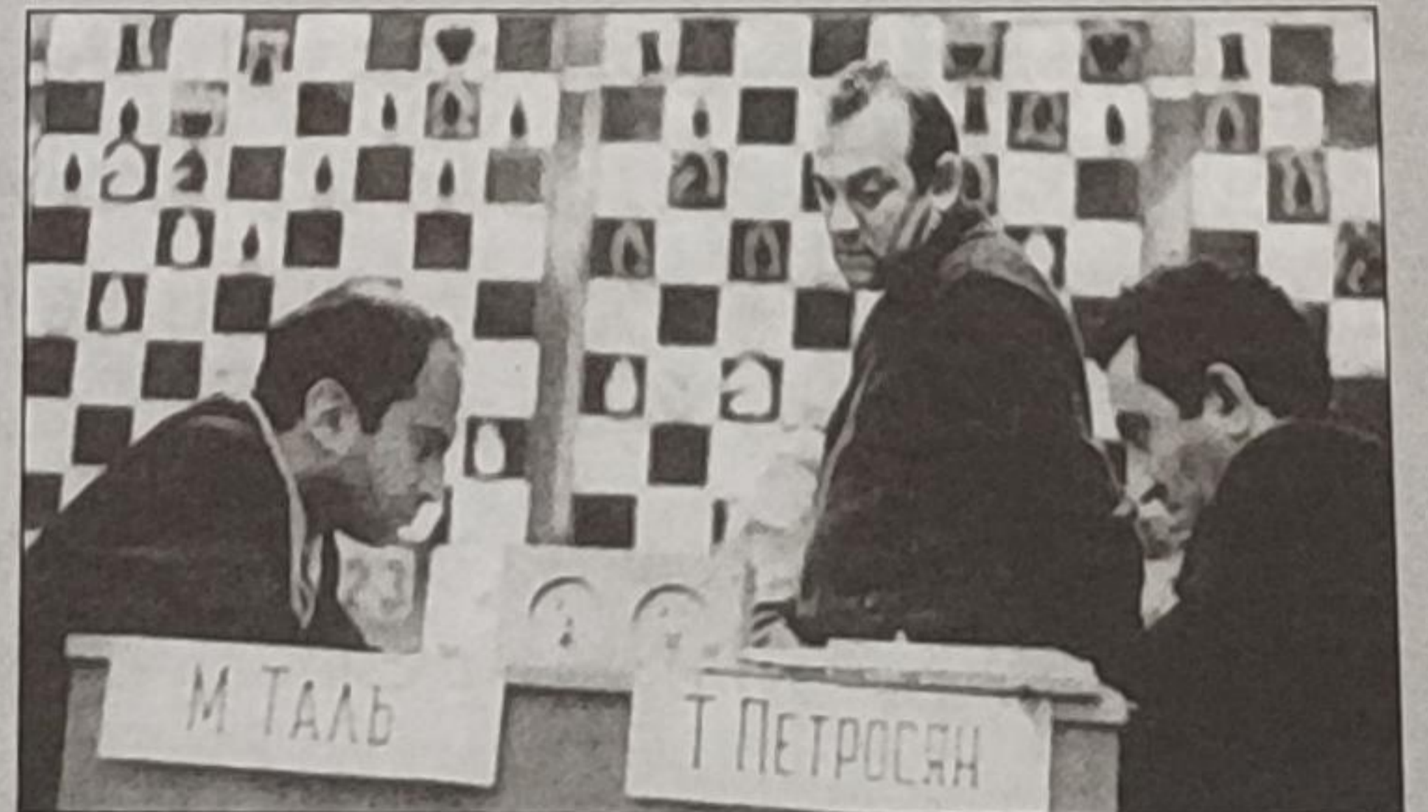
کورچنوی نظاره گر بازی تال - پتروسیان