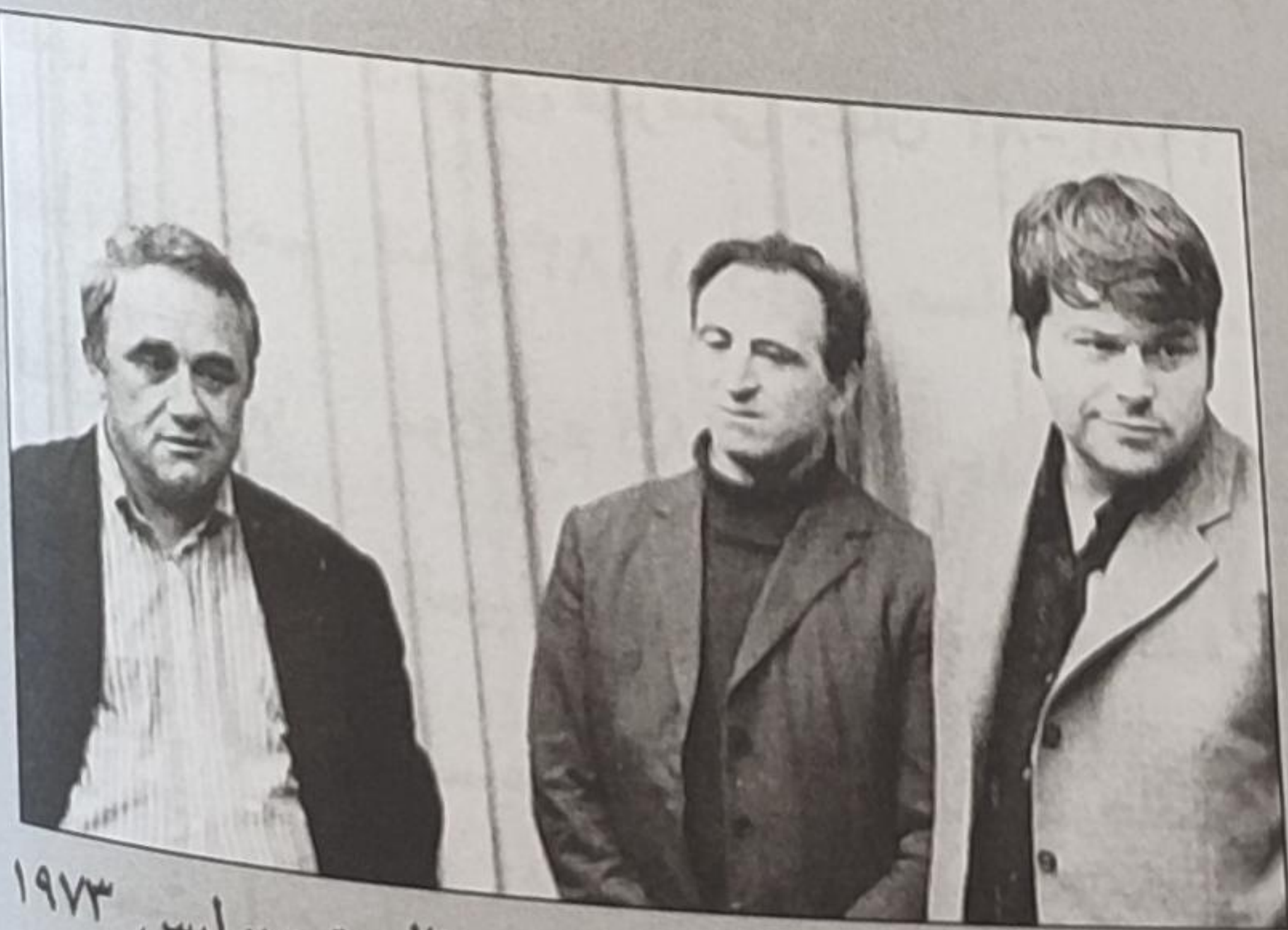
گلر، پولوگایفسکی و هورت در اینترزونال پتروپولیس ۱۹۷۳