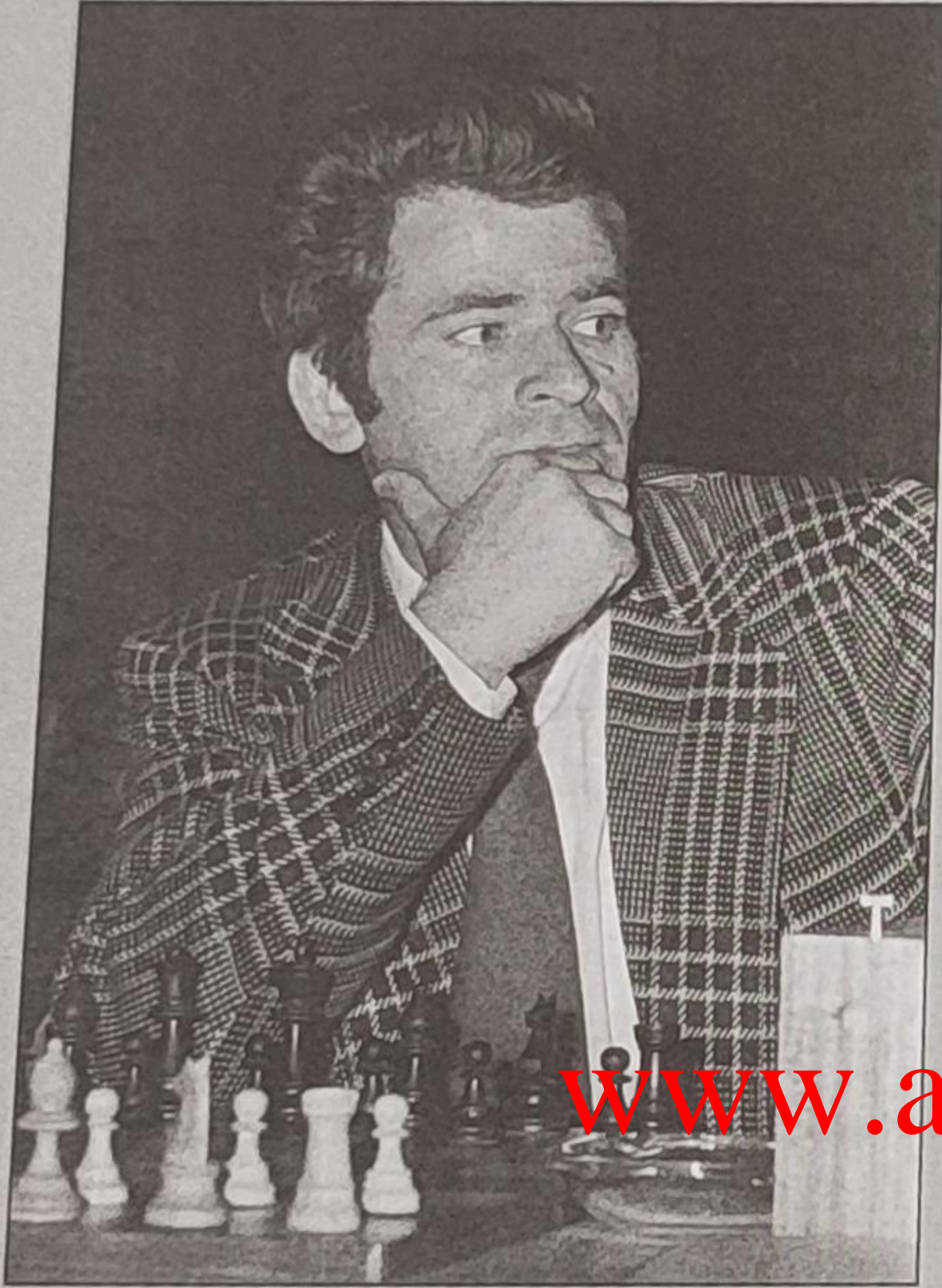
بوریس اسپاسکی در مسکو ۱۹۷۳