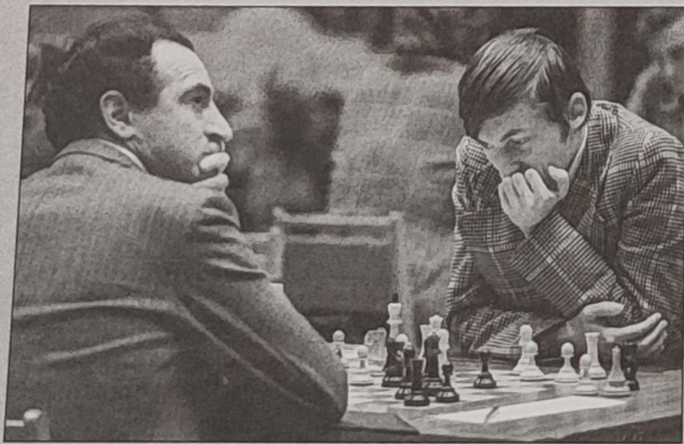
مسکو ۱۹۷۳: کارپوف پیش از انجام حرکت شانزدهم مقابل پولوگایفسکی