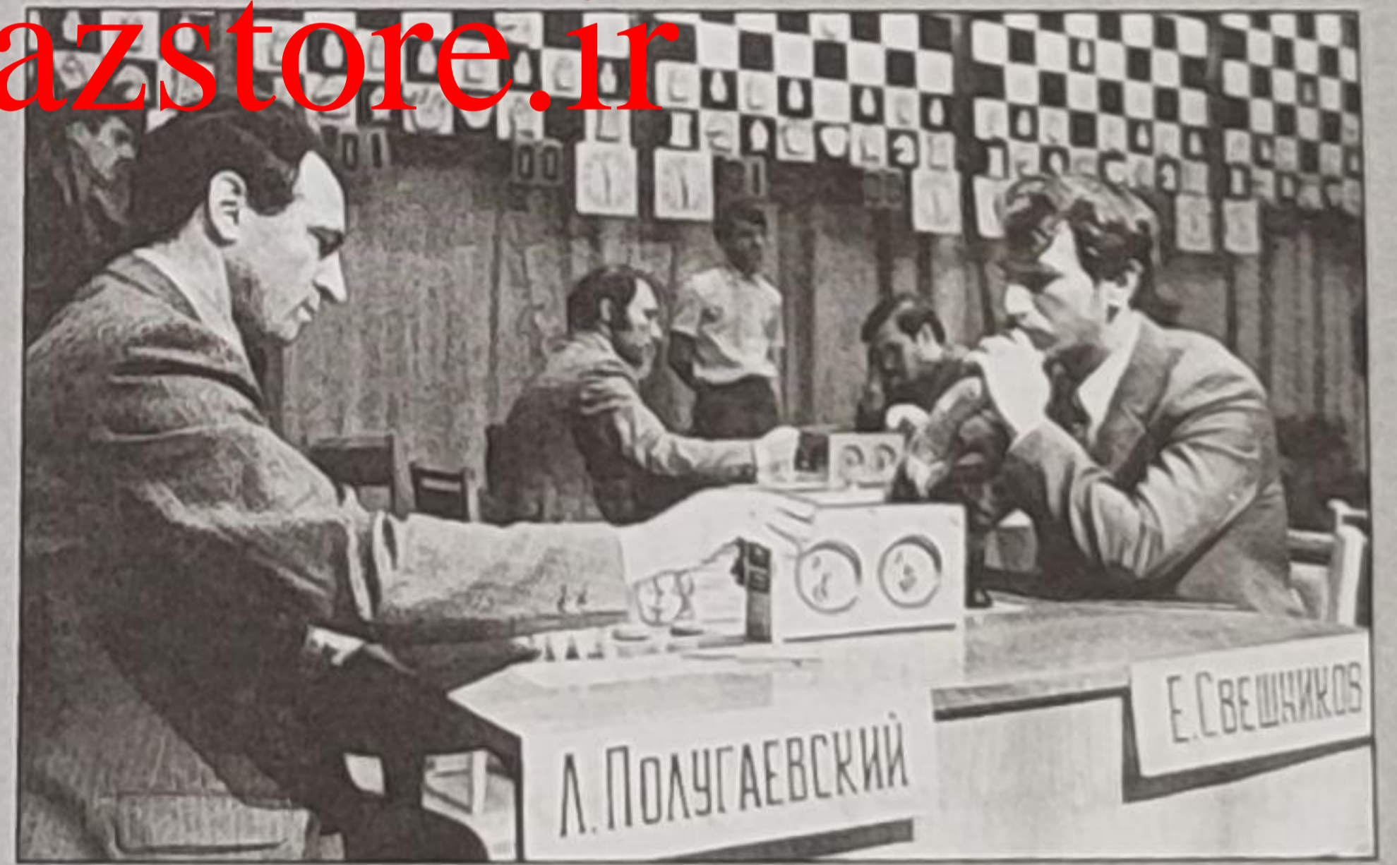
پولوگایفسکی - اسوشنیکوف در مسکو ۱۹۷۳