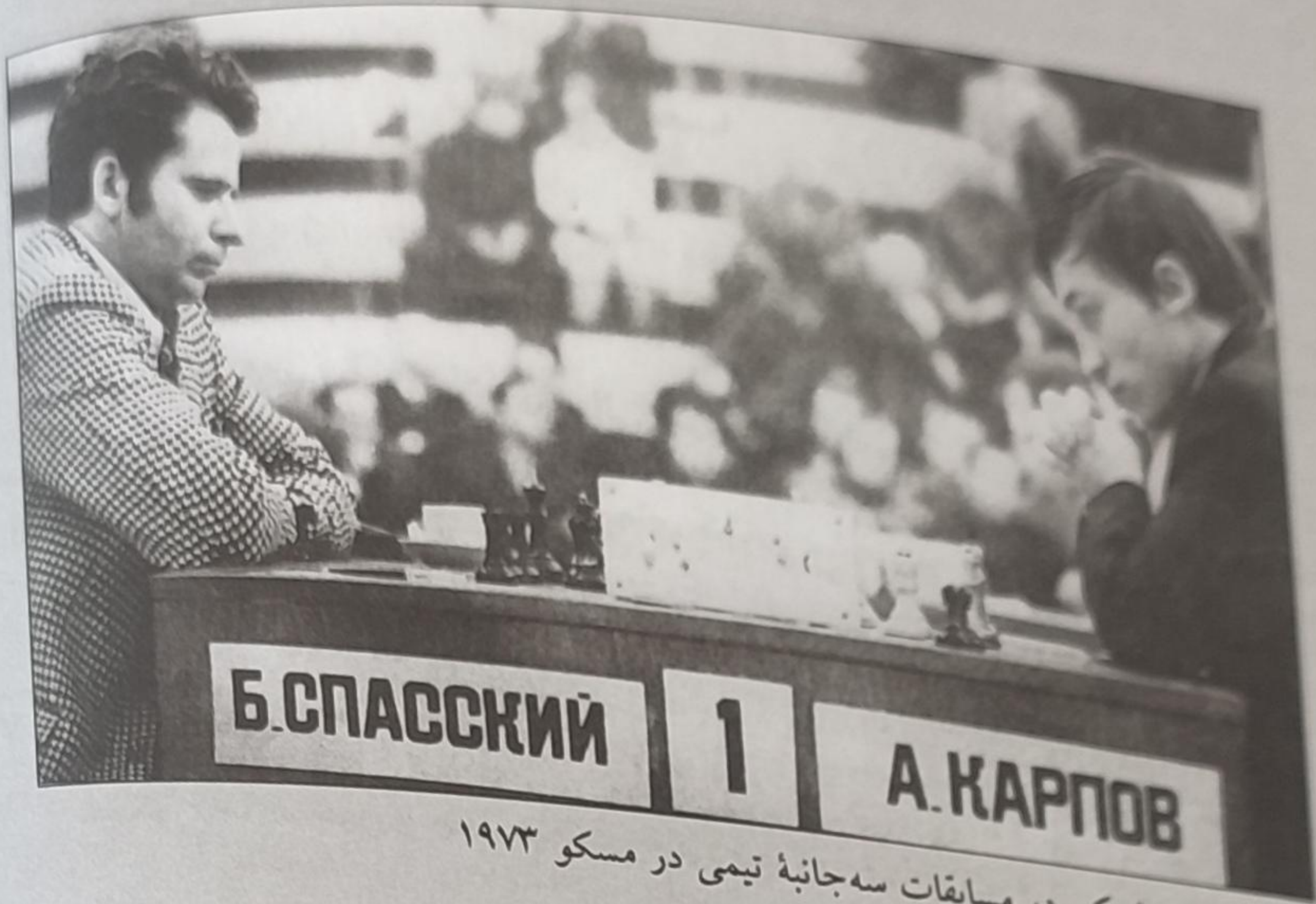
کارپوف - اسپاسکی در مسابقات سه‌جانبه تیمی در مسکو ۱۹۷۳