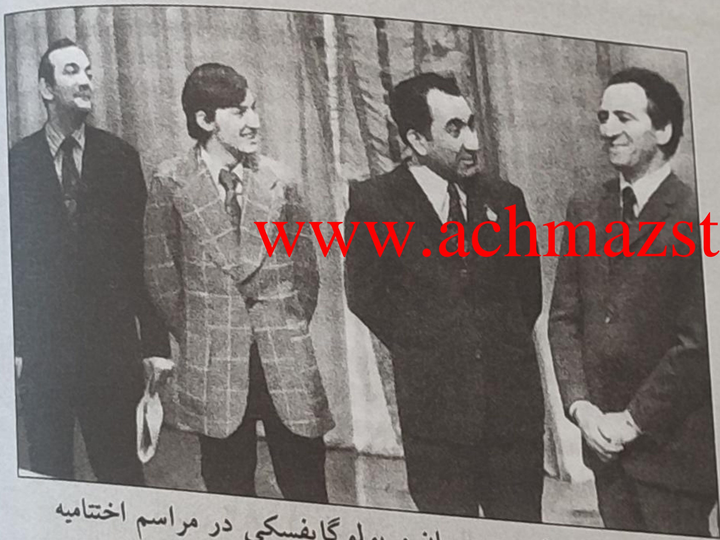
کورچنوی، کارپوف، پتروسیان و پولوگایفسکی در مراسم اختتامیه قهرمانی شوروی