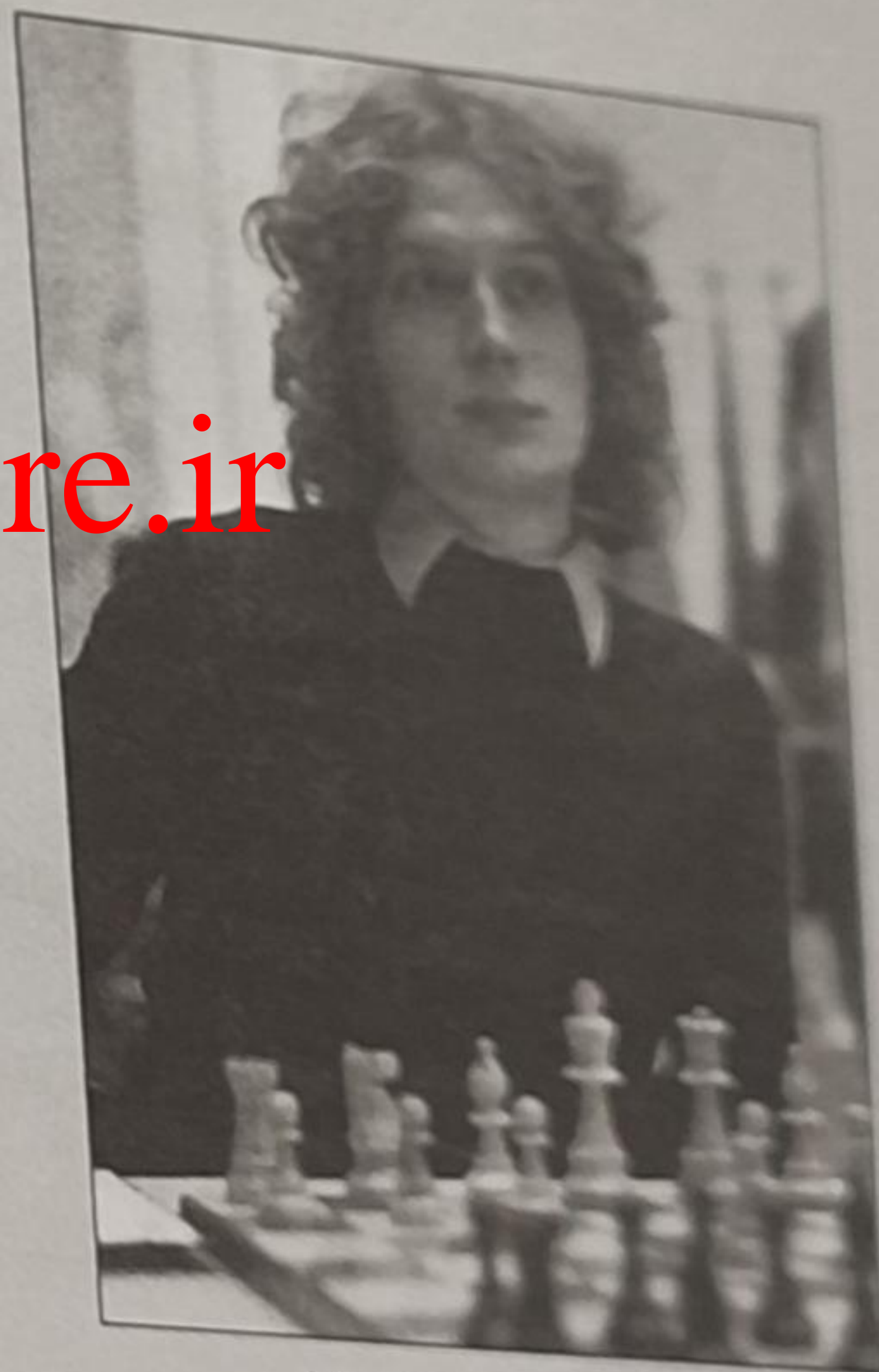
یان تیمان در هیلورسوم ۱۹۷۳