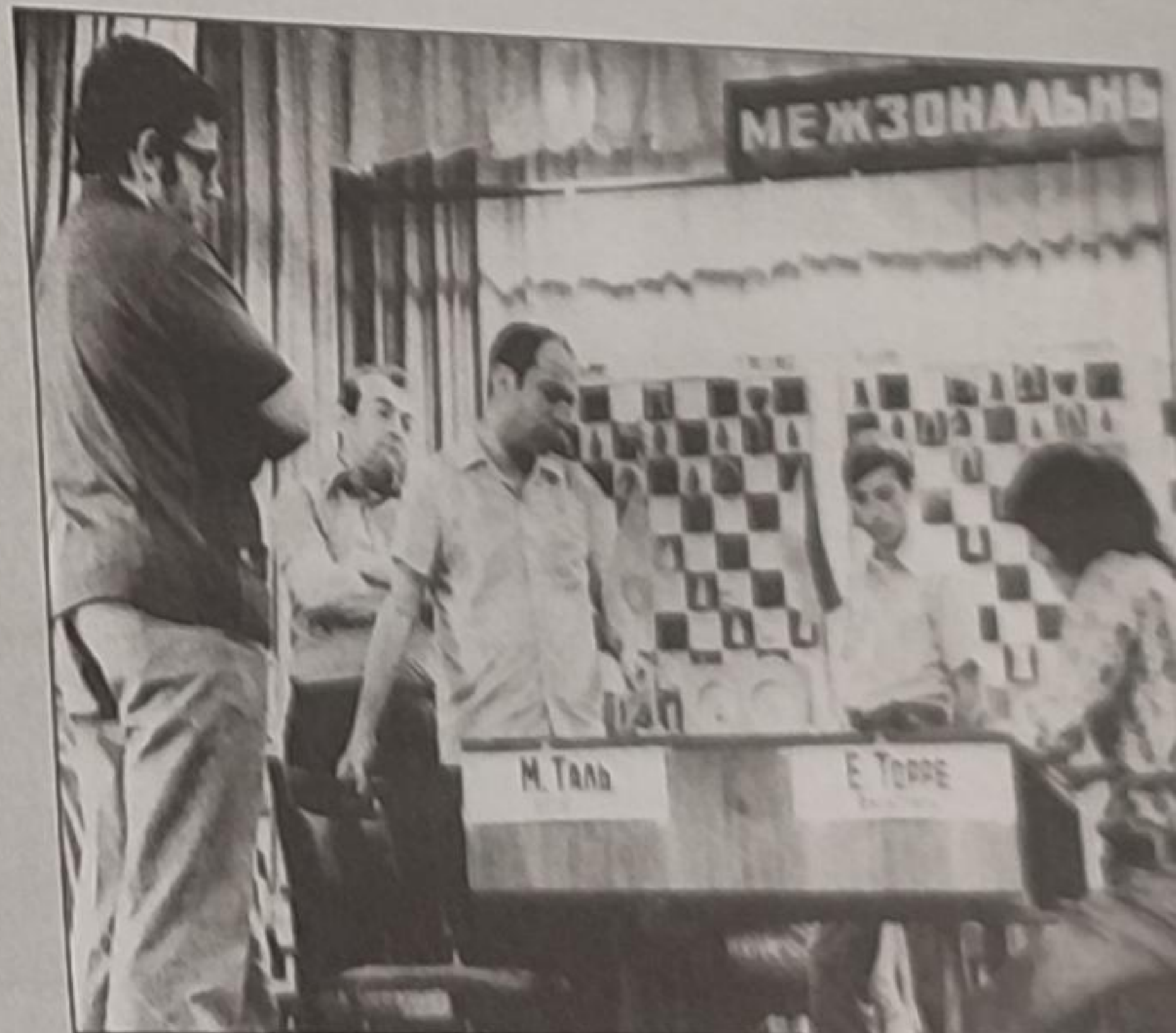
در دور دوم اینترزونال لنین‌گراد ۱۹۷۳ مغلوب توره می‌شود