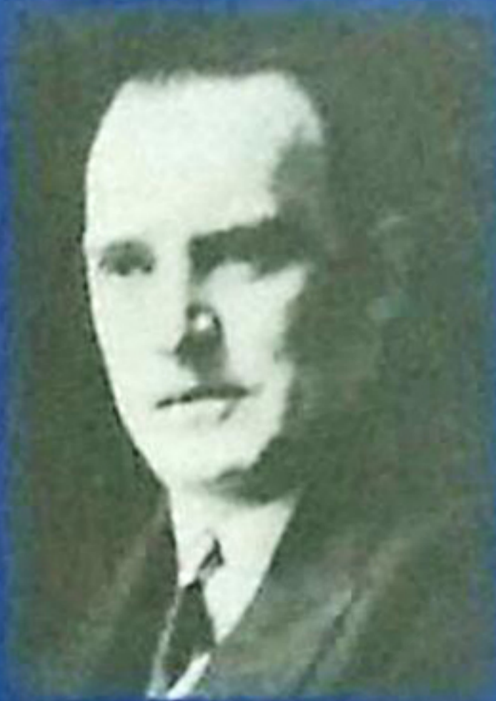
الکساندر کوتوف سال ۱۹۲۶

الکساندر کوتوف، شطرنج‌باز نامدار روس، پس از ثانویسک و اسمیلوف سومین استادبرگی بود که در شوروی مدرسه شطرنج خود را تأسیس کرد. کتابهای آموزشی او نیز شهرت جهانی داشتند و به زبانهای مختلف ترجمه شدند.