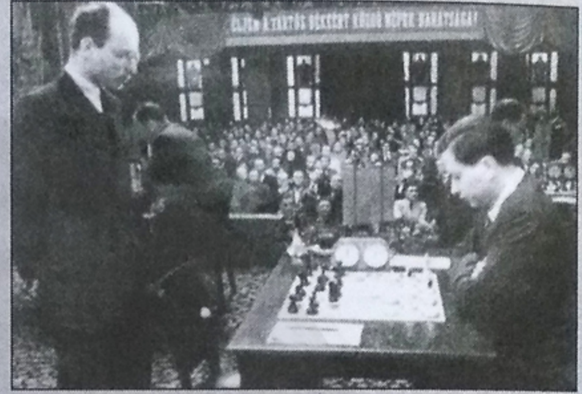
کرس - برونشتاین در بوداپست ۱۹۵۰؛ سفید در لحظه انجام حرکت یازدهم خود