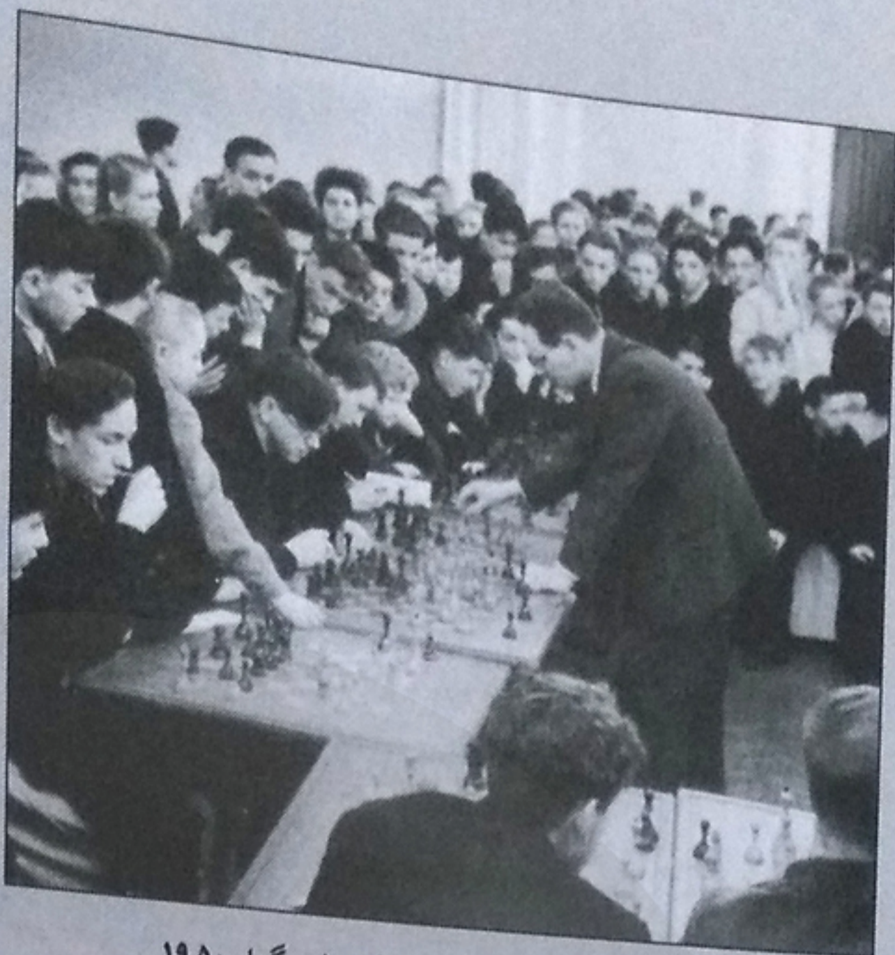
باتونیک در یک مسابقه همزمان (۱۵ میز) در لنینگراد ۱۹۵۰