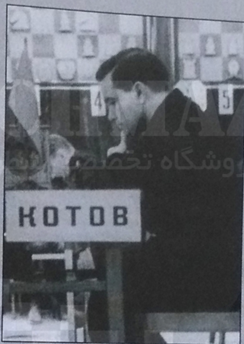
کوتوف در رویارویی بوداپست - مسکو ۱۹۴۹