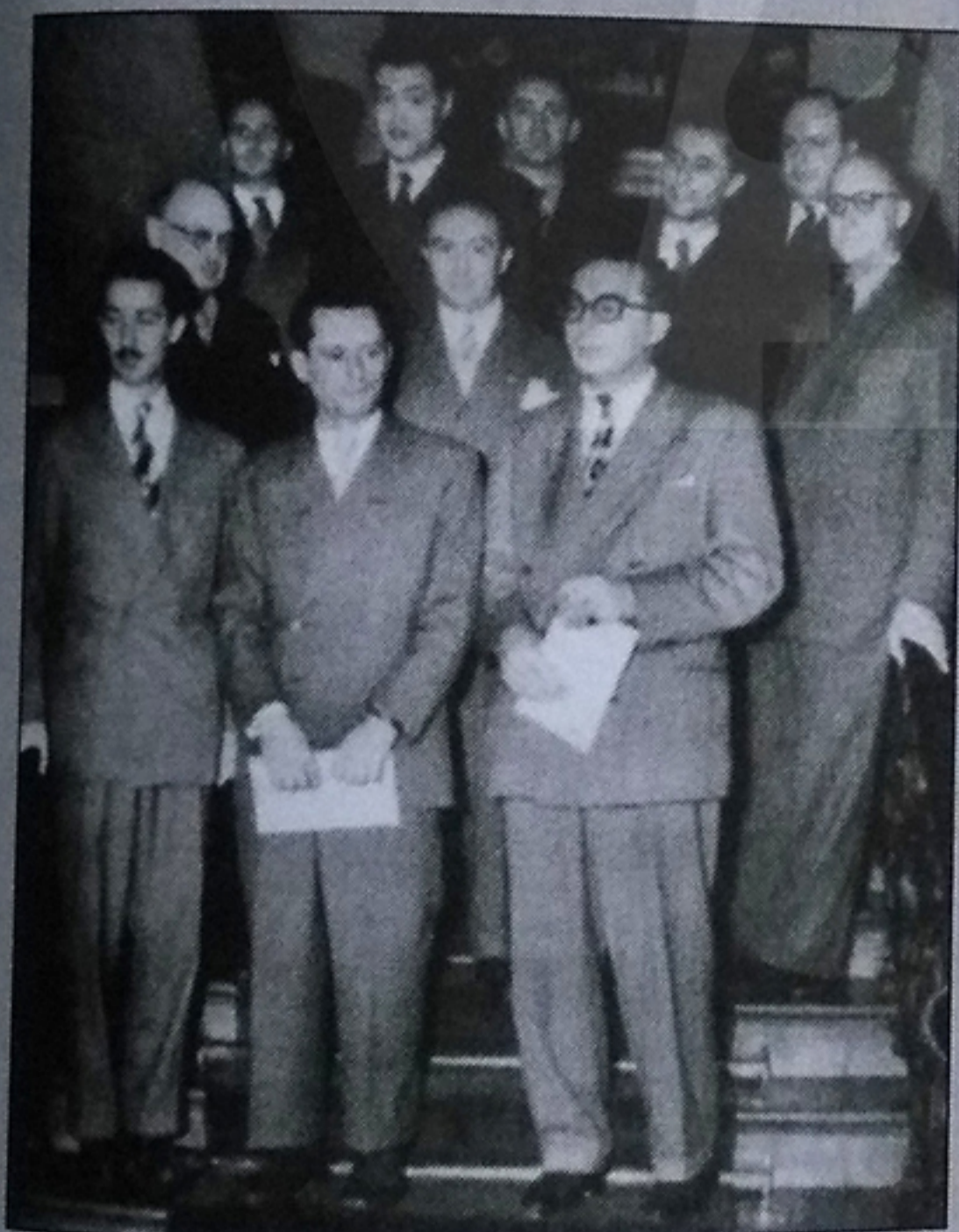
آمستردام ۱۹۵۰؛ ردیف جلو: گلیگوریچ، روسولیمو و پیلنیک. ردیف وسط: تارتاکوور، نایدورف، وان شلتینگا. ردیف عقب: رشفسکی، پرینس، گودموندسن، تریفونوویچ و استالبرگ