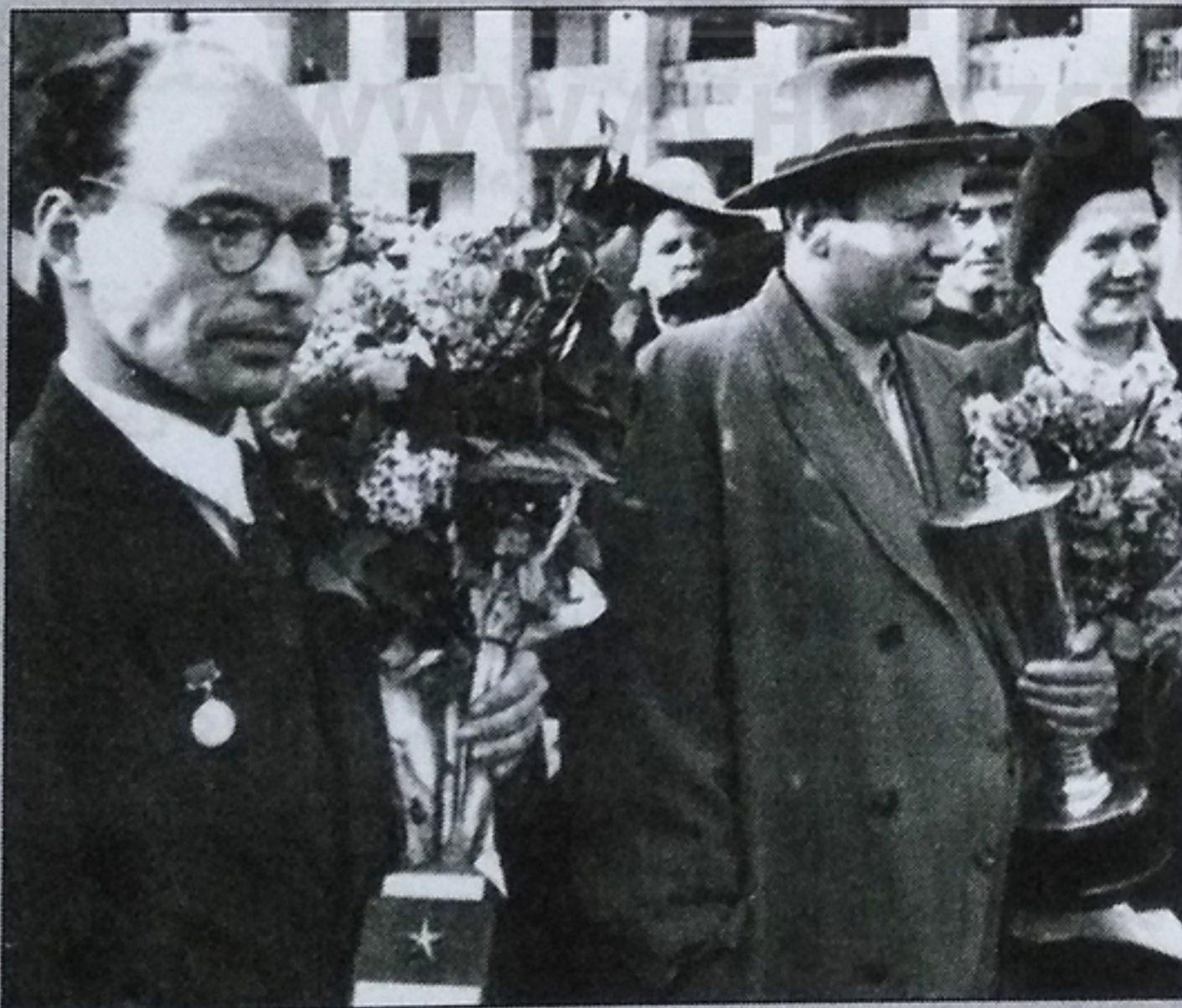
فاتحین بوداپست ۱۹۵۰؛ برونشتاین و بولسلافسکی در فرودگاه مسکو