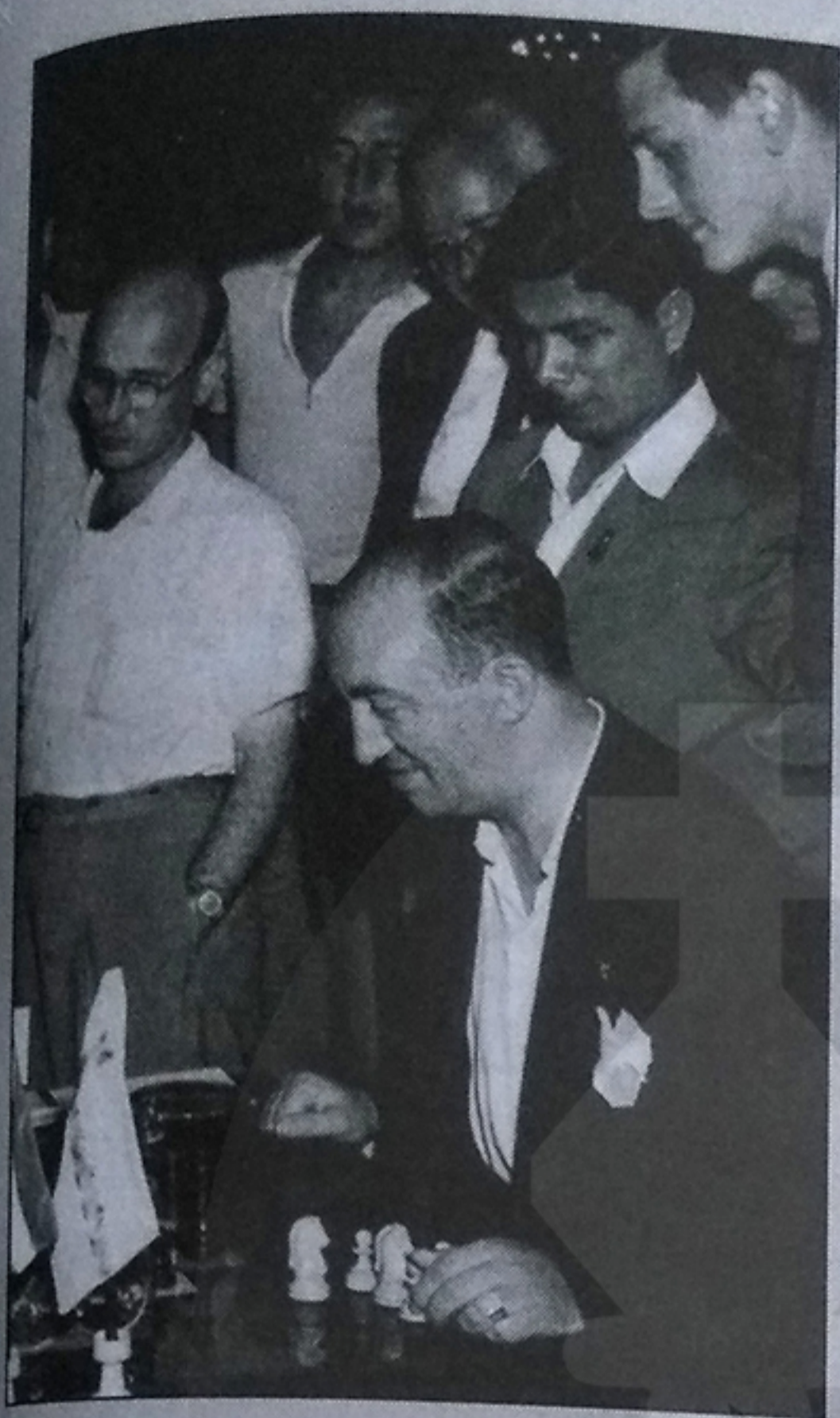
رشفسکی و نایدورف در المپیاد دوبرونیک ۱۹۵۰